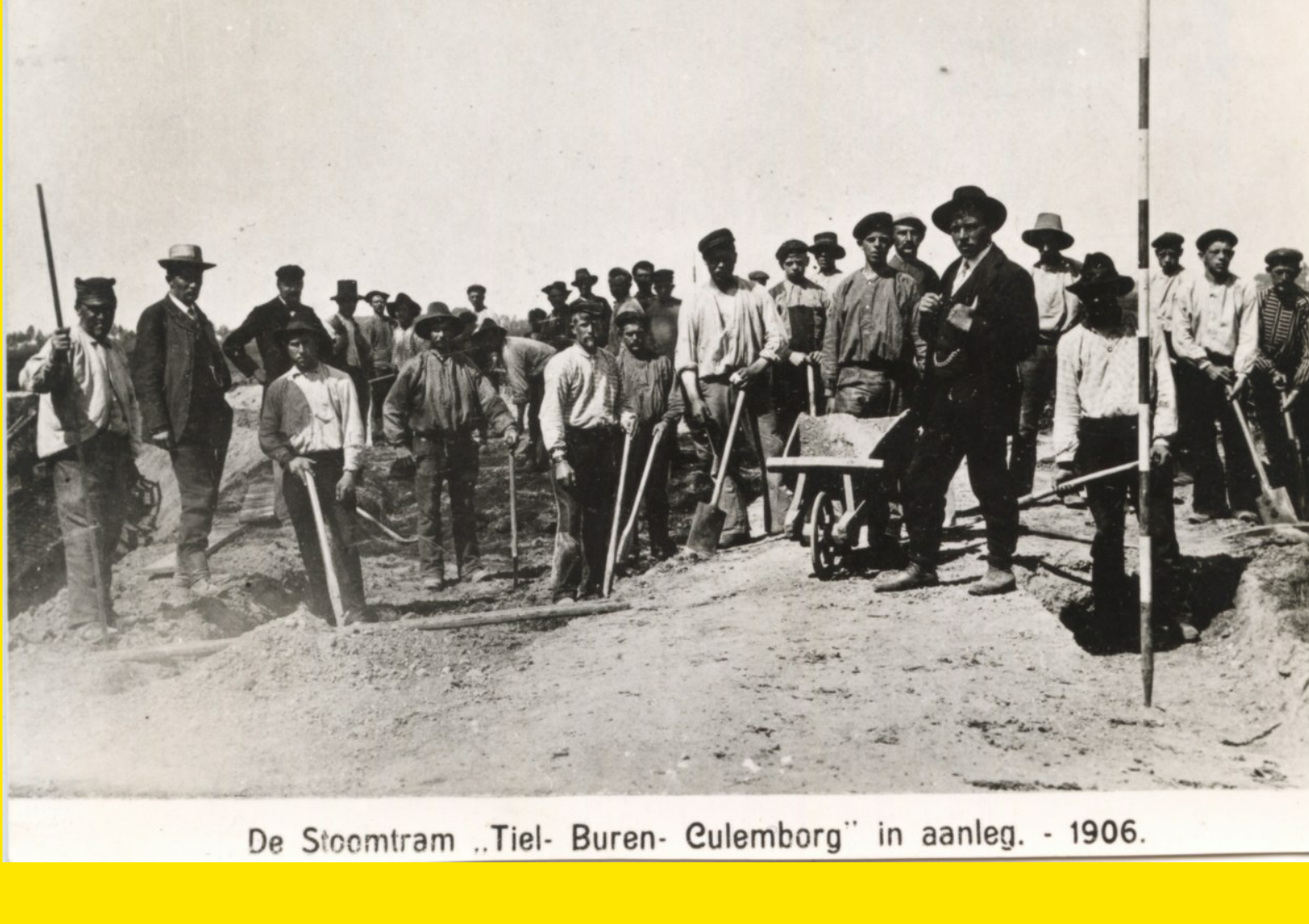
De Stoomtram „Tiel- Buren- Culemborg” in aanleg. - 1906.