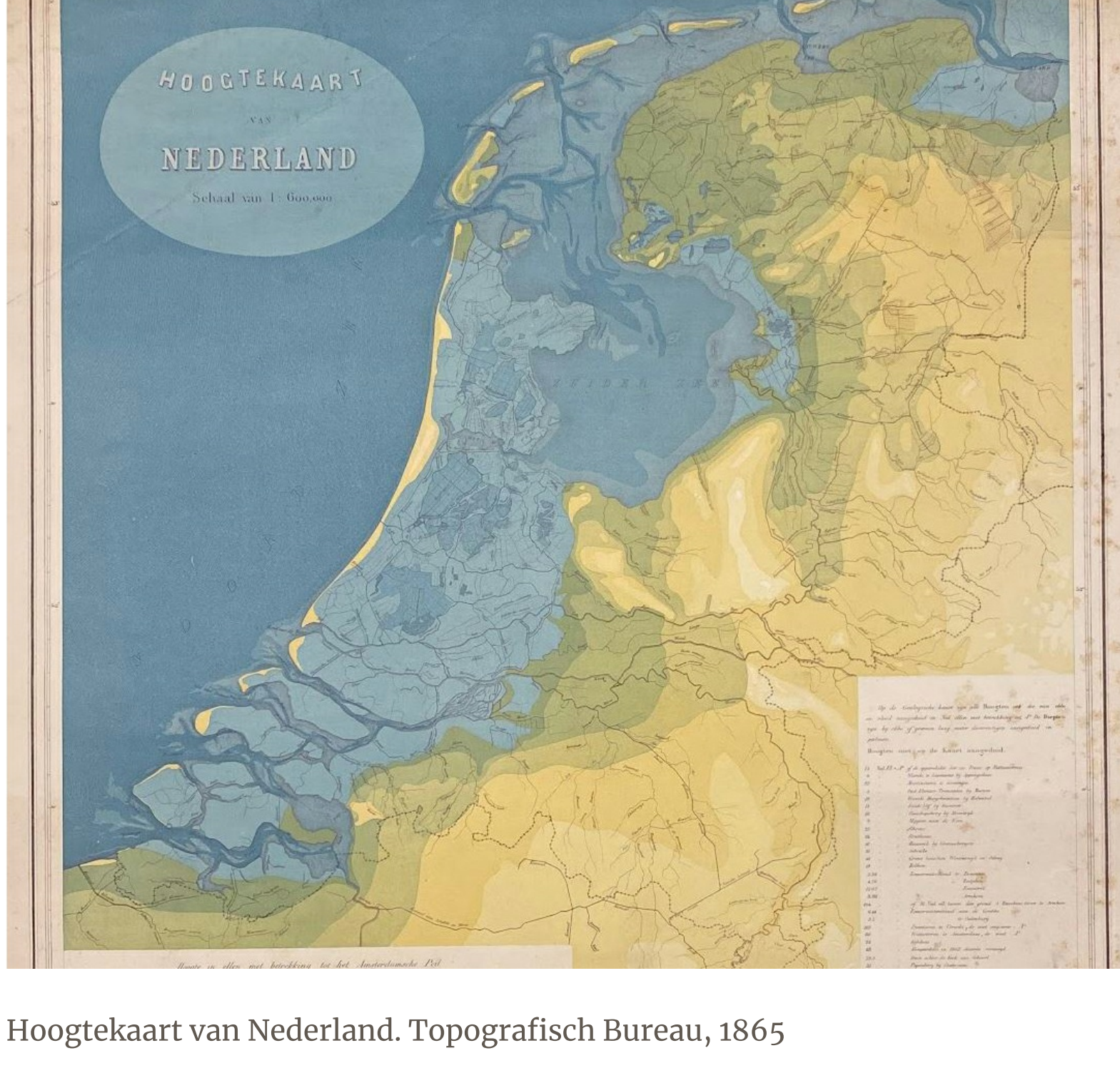
Hoogtekaart van Nederland. Topografisch Bureau, 1865

Begin februari opende het Nationaal Archief in Den Haag de tentoonstelling 'Op de kaart – Kijk met kaarten naar de wereld van toen en nu'. Tot 22 oktober is in deze cartografie tentoonstelling origineel kaartmateriaal te bewonderen, deels nooit eerder vertoond. De tentoonstelling Op de kaart geeft inzicht in de ideeën en bedoelingen achter de kaarten. De kaarten zijn gemaakt vanuit verschillende perspectieven en uit verschillende tijden. Dit alles wordt omlijst met interviews over de persoonlijke betekenis die historische kaarten voor mensen kunnen hebben. Bezoekers wordt gevraagd hun persoonlijke ervaringen en inzichten te delen voor een grote interactieve mindmap van deze tentoonstelling.