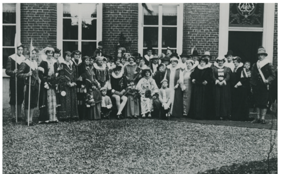
Doe mee met Voet en misschien organiseert u wel een historische verkleedpartij. Zoals hier ter gelegenheid van het huwelijk van Juliana en Bernhard in 1937.

We zijn ons er, mede door Corona, van bewust dat we een bestuur van grijze koppen hebben. Dus zeiden we tegen elkaar: we moeten eens rondkijken naar een volgende generatie bestuursleden en naar mensen die klussen willen doen. Het bestuur vergadert een avond per maand; de klussen zijn