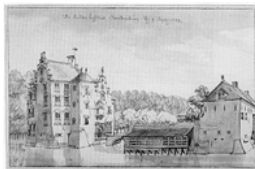
Afbeelding 5: Kasteel Sandenburg