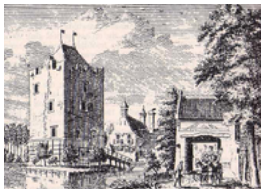
Afbeelding 4: Lunenburg

Tijdens de Tweede Wereldoorlog, in september 1944,