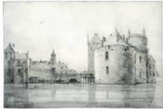
Afbeelding 12: Kasteel Culemborg