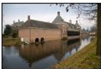
Afbeelding 9: Kasteel Amerongen

Drostestraat 20, 3958 BK Amerongen Al in 1286 wordt er melding gemaakt van een Kasteel in Amerongen. Door de jaren heen groeide de stenen woontoren uit tot een echte burcht. Zoals zo vaak kon ook dit kasteel vernielingen en verwoestingen niet ontlopen. Het werd wel steeds weer opgebouwd. De huidige vorm dateert uit de 17e eeuw en werd in 1684 voltooid. In die tijd was symmetrie erg populair