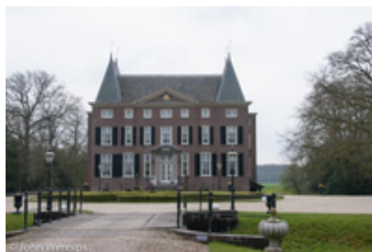
Afbeelding 1: Kasteel Hardenbroek

Hoewel niet direct aan de Langbroeker Wetering gelegen maakt het huis wel degelijk deel uit van de buitenplaatsen aan de Wetering.