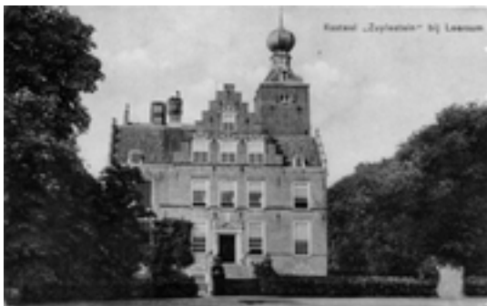
Afbeelding 8: Zuylestein