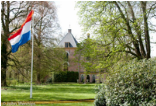
Afbeelding 3: Hindersteyn