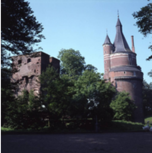
Afbeelding 11: Kasteel Duurstede