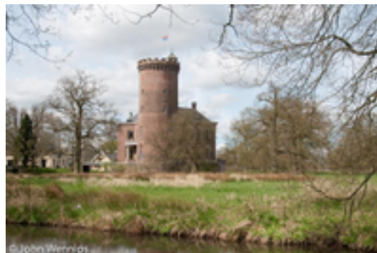
Afbeelding 2: Sterkenburg

Langbroekerdijk 10, Driebergen-Rijsenburg Bouw: 1261 t/m 14e eeuw. Waarschijnlijk gesticht door een lid van de familie Van Wulven. De Van Wulvens waren in 1196 dienstmannen van de bisschop in Utrecht.