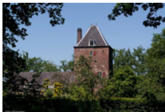
Afbeelding 7: Kasteel Walenburg