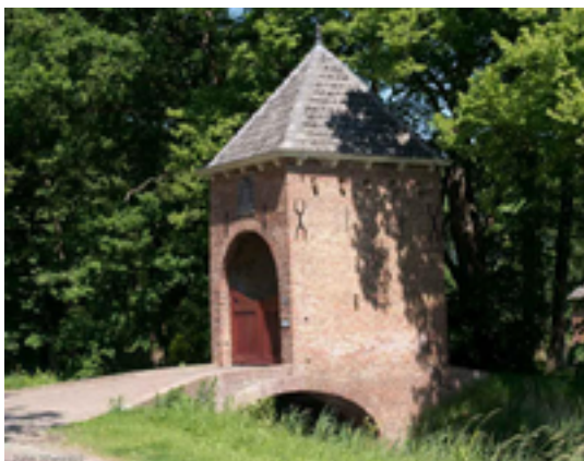
Afbeelding 6: kasteel Groenestein