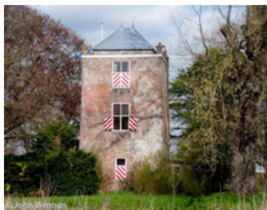
Afbeelding 10: Natewisch