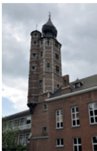
De toren van het voormalig Hof van Hoogstraten.

koffie en lunch op eigen gelegenheid een keuze uit de talloze (veelal kleinere) horecagelegenheden in Mechelen maakt. Houdt u er wel rekening mee dat een echt Belgisch middagmaal veelal een warme lunch is en nogal wat tijd kan kosten! U kunt ook een broodje bij u steken. Aan u de keuze. Wandelschoenen zijn aangeraden want het Mechelse plaveisel is op veel plaatsen nogal hobbelig. Dus als u niet makkelijk loopt, bedenk u dan nog eens! Op het programma staat voor allemaal samen een uitgebreide stadswandeling door het historische stadscentrum. Vervolgens is aan u de keuze of u later op de dag een boottochtje over de Binnendijle, de levensader van Mechelen, of een rondleiding door het Museum Hof van Busleyden wil maken. Het Hof van Busleyden is een fraai stadspaleis en tegenwoordig in gebruik als museum. Het is onlangs na een verbouwing weer geopend met de expositie 'Roep om Rechtvaardigheid. Kunst en Rechtspraak in de Bourgondische Nederlanden' met topwerken uit o.a. het Prado in Madrid en de Gemäldegalerie in Berlijn. Wij hebben een entree voor 30 personen gereserveerd.