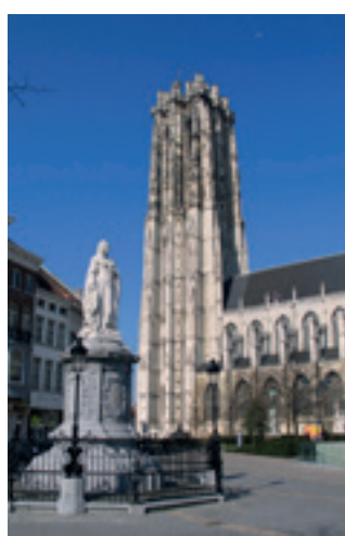
Standbeeld van Margaretha van Oostenrijk voor de Sint-Romboutskathedraal.