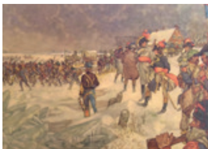
De Fransen steken in 1795 de Lek over bij Culemborg.

Dinsdag 24 april 2018. Lezing over de schoolplaten van J.H. Isings door Walter Lodewijk.