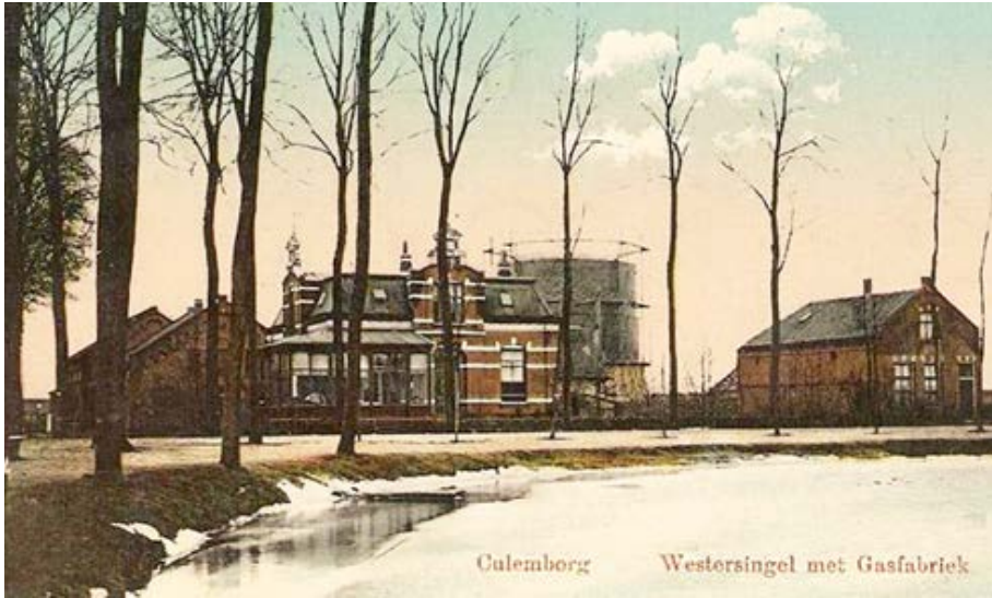
Prentbriefkaart villa woonhuis ovenbaas, gashouder, fabrieksgebouw 1905