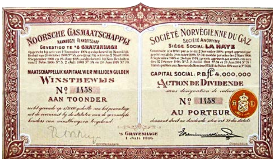
Winstbewijs Noorsche Gasmaatschappij, website oude aandelen 1915

Die Noorsche gasmaatschappij, opgericht in 1904 en gevestigd te 's Gravenhage, verwierf in dat jaar concessies tot exploitatie van een gasfabriek om straten en stegen van Kristiansand en Årendal, gelegen in Noorwegen, te verlichten. In 1905 volgde Ålesund. Concessies die overigens in 1916/1917 weer werden verkocht. Daarnaast werd in 1911 het Syndicaat Zweden gevormd dat in 1914 op vijf plaatsen in Zweden concessie verkreef met een looptijd van 30 á 35 jaar. In 1916 kwamen ze in werking en renderden aan-