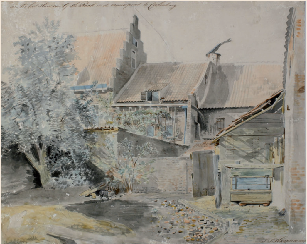
4 Achter het huis van G. de Raad Pen, penseel in kleur Afmetingen: 33,5 x 42 cm Inv.nr.: MEW 1130 Geannoteerd links boven: 'achter het Huis van G. de Raad in de nieuwpoort te Culenburg?'; rechts onder: 'L.J. Hansen 184?' (het laatste cijfer is afgesneden).