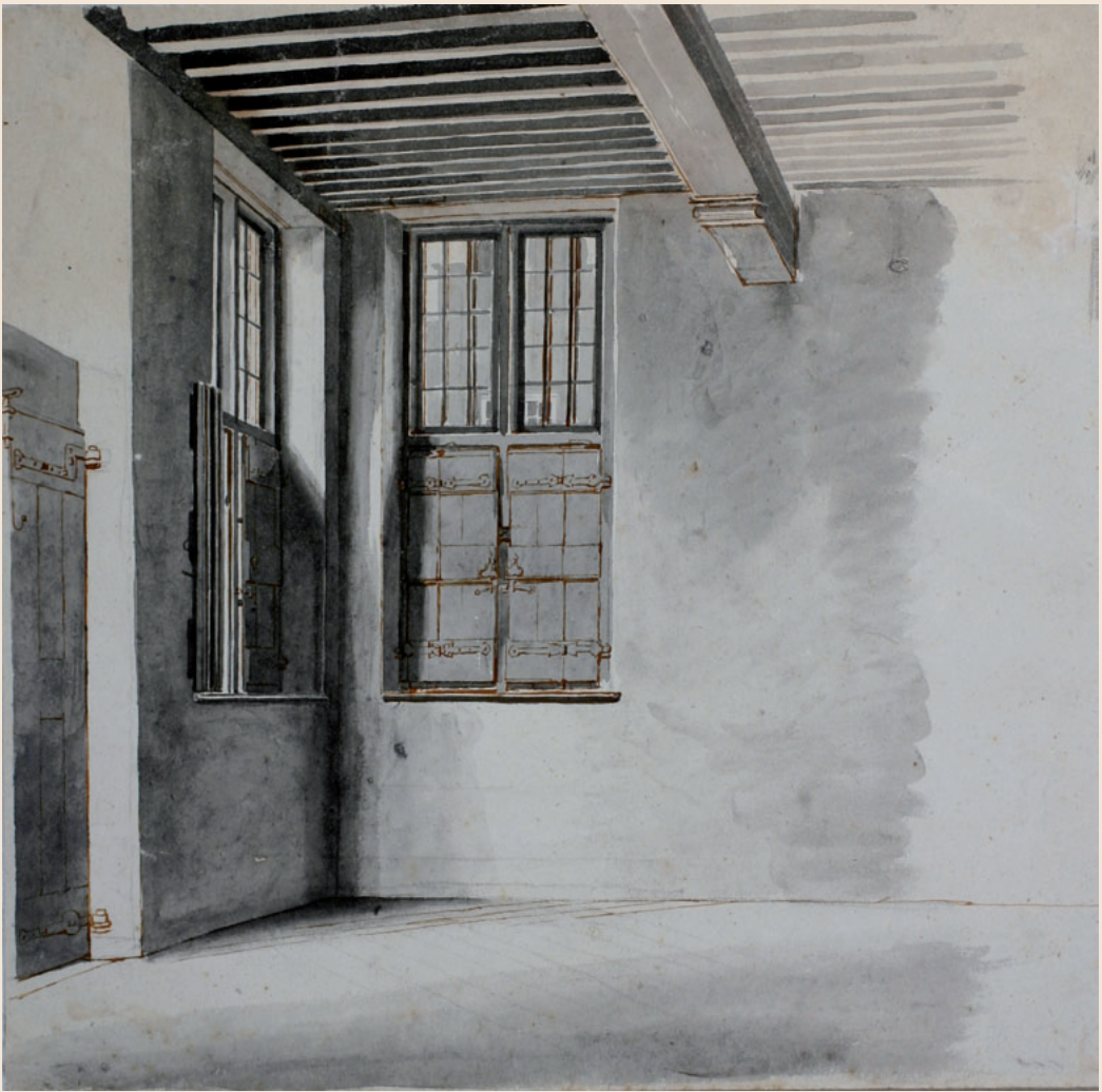
12 Hoekje in de burgerzaal van het stadhuis Pen in bruin en penseel in grijs Afmetingen: 29,6 x 29,8 cm Inv.nr.: MEW 1126 Niet geannoteerd.