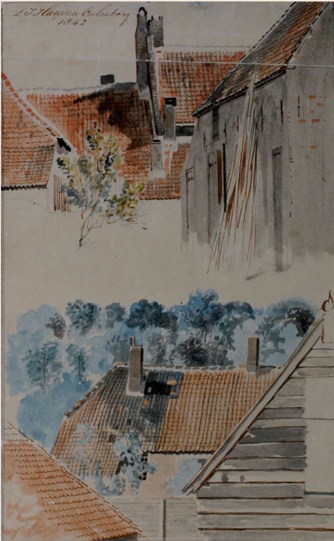
30 Gevels en dakpartijen Pen, penseel in kleuren Afmetingen: 20 x 12,5 cm Inv.nr.: MEW 1160 Geannoteerd links boven: 'L.J. Hansen Culemborg 1842'.