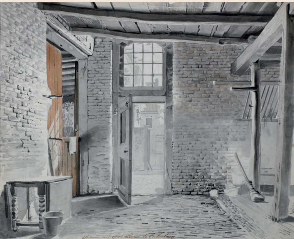
5 Schuur van G. de Raad Penseel in grijs en bruin Afmetingen: 34,7 x 43,2 cm Inv.nr.: MEW 1131 Geannoteerd: 'Schuur van G. de Raad te Culenburg'.

Dit doorkijkje is typerend voor Hansen. Het licht valt binnen via het bovenlicht en de openstaande deur, die ons tegelijk een kijkje naar de binnenplaats gunt. Vooral het spel van de staande balken en het plafond boeien de kunstenaar. In het vertrek staat links een zogenaamde hangoortafel, een tafel waarvan de beide uiteinden van het blad naar beneden geklapt kunnen worden. De achterruimte van De Klok aan de Varkensmarkt is nu geheel verbouwd ten behoeve van een disco-