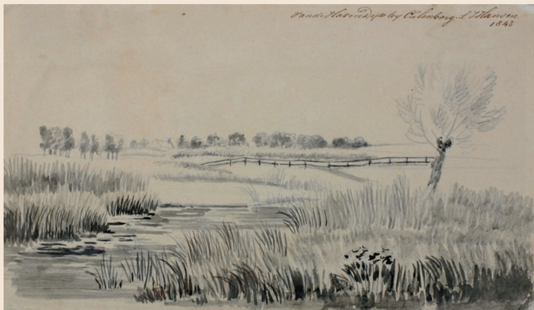
23 Gezicht vanaf de Havendijk Penseel in grijstinten Afmetingen: 12 x 20,2 cm Inv.nr.: MEW 1148 Geannoteerd: 'Van de Havendijk bij Culenborg L.J. Hansen 1843'.