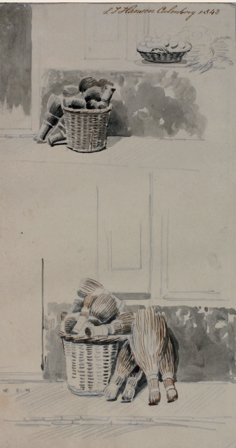
28 Mand met bezems Penseel in grijs, pen in bruin Afmetingen: 20,5 x 11 cm Inv.nr.: MEW 1147 Geannoteerd rechts boven: 'L.J. Hansen Culemborg 1843'.