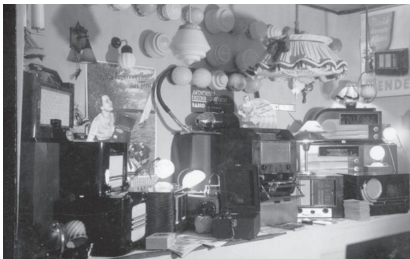
Winkelinterieur met verlichtingsartikelen en radio's.