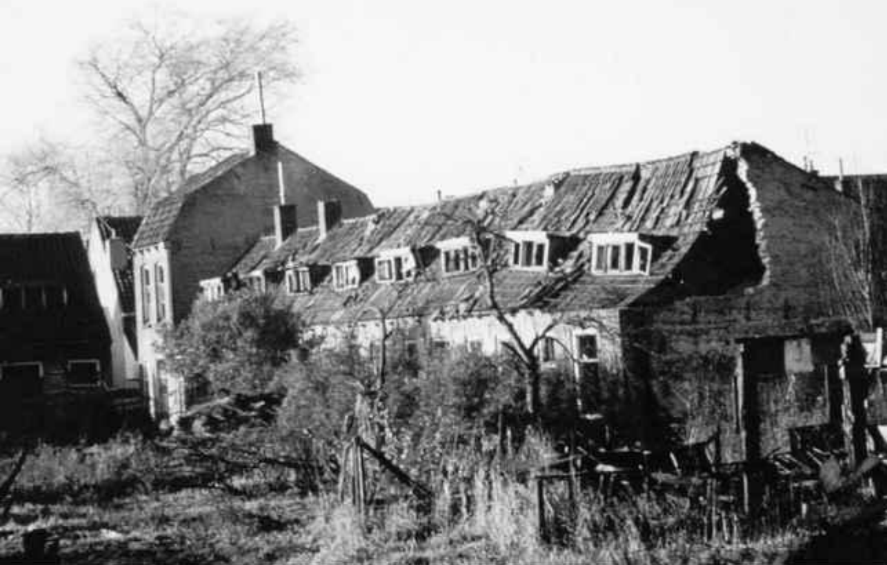
De Mariabuur, gelegen achter de Prijsstraat/ Westerväl.

plaatfundering, de ondergrond in aanmerking nemend een wel erg ongelukkige keuze. Eén zo'n funderingsplaat is inderdaad gebroken terwijl het huis al bewoond was. Een ramp voor het bestuur van de ACWV.