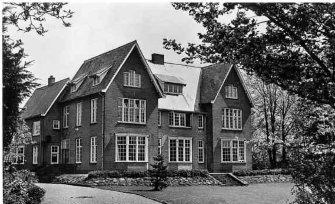
De Koningin Juliana- school aan de Wilhelminadreef.