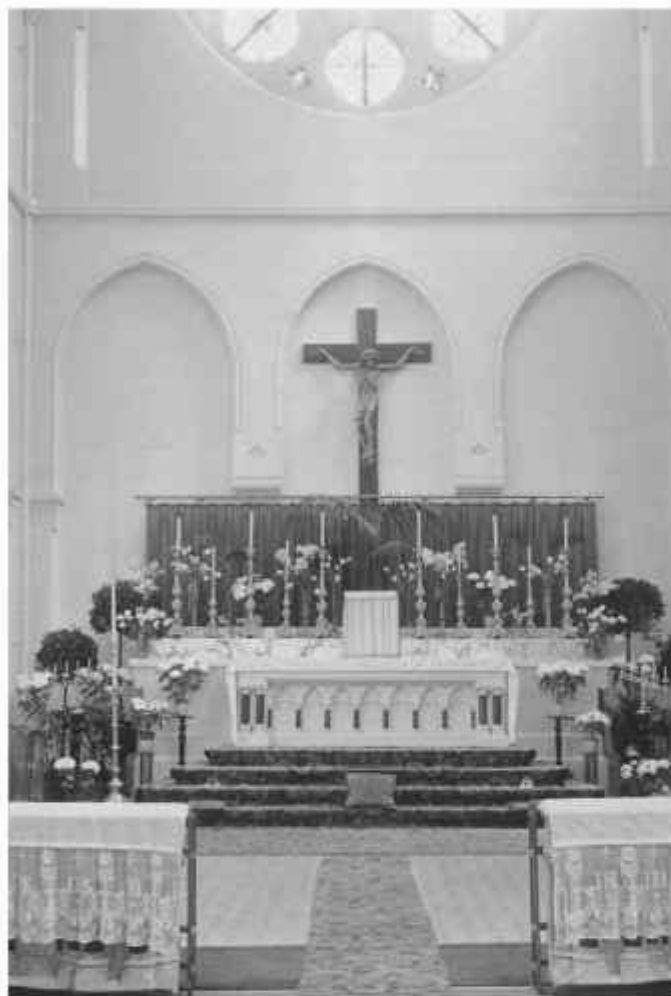
Het interieur van de R.K. Sint Barbarakerk.

hadden allemaal een geestelijk adviseur, in de persoon van een van de vele parochiepriesters. Er kwamen katholieke scholen en zorginstellingen. Ook in de politiek kregen katholieken meer stem. De kerk had overal antwoord op. Men hoefde niet zich niet druk te maken over het eigen geweten, want dat deed de kerk! Omtrent gezinsplanning bestond geen twijfel: het katholieke volksdeel moest groter worden, mede daarom waren alle vormen van geboortebeperving taboe. De geestelijkheid propageerde het grote katholieke gezin. Als een jonge moeder niet snel genoeg opnieuw zwanger werd, kwam de pastoor of de kapelaan informeren naar de reden hiervoor. Veel mensen hebben veel verdriet gehad om deze gang van zaken.