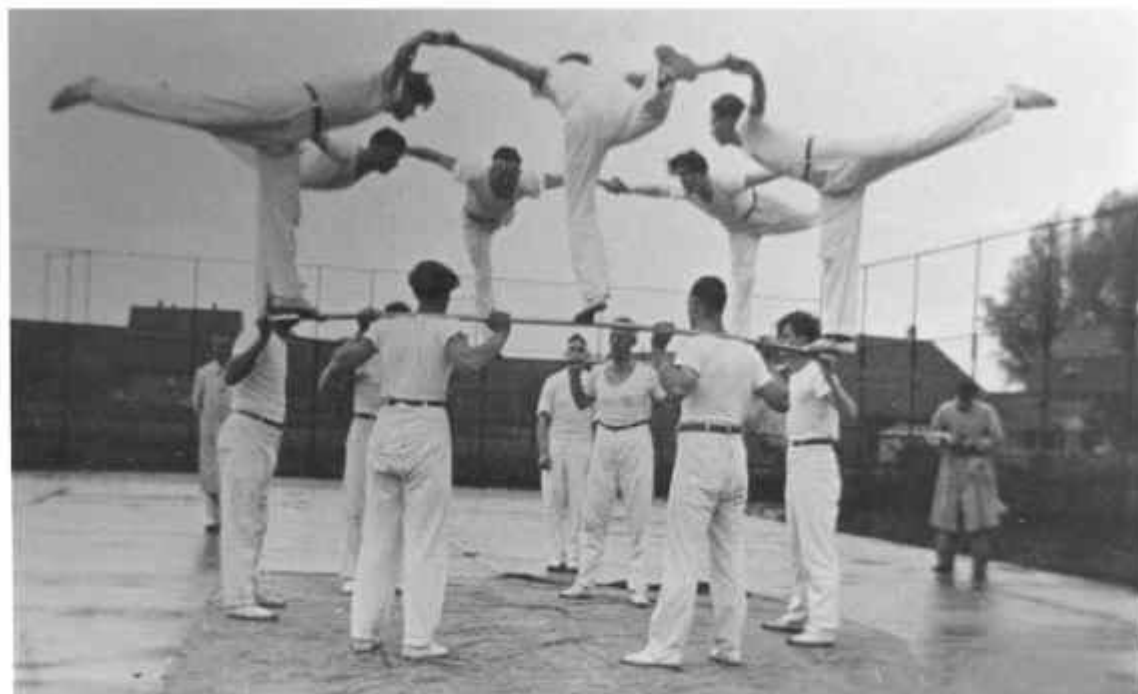
Gymnasten van Kunst & Kracht op het tennisveld van Vriendenschaar.