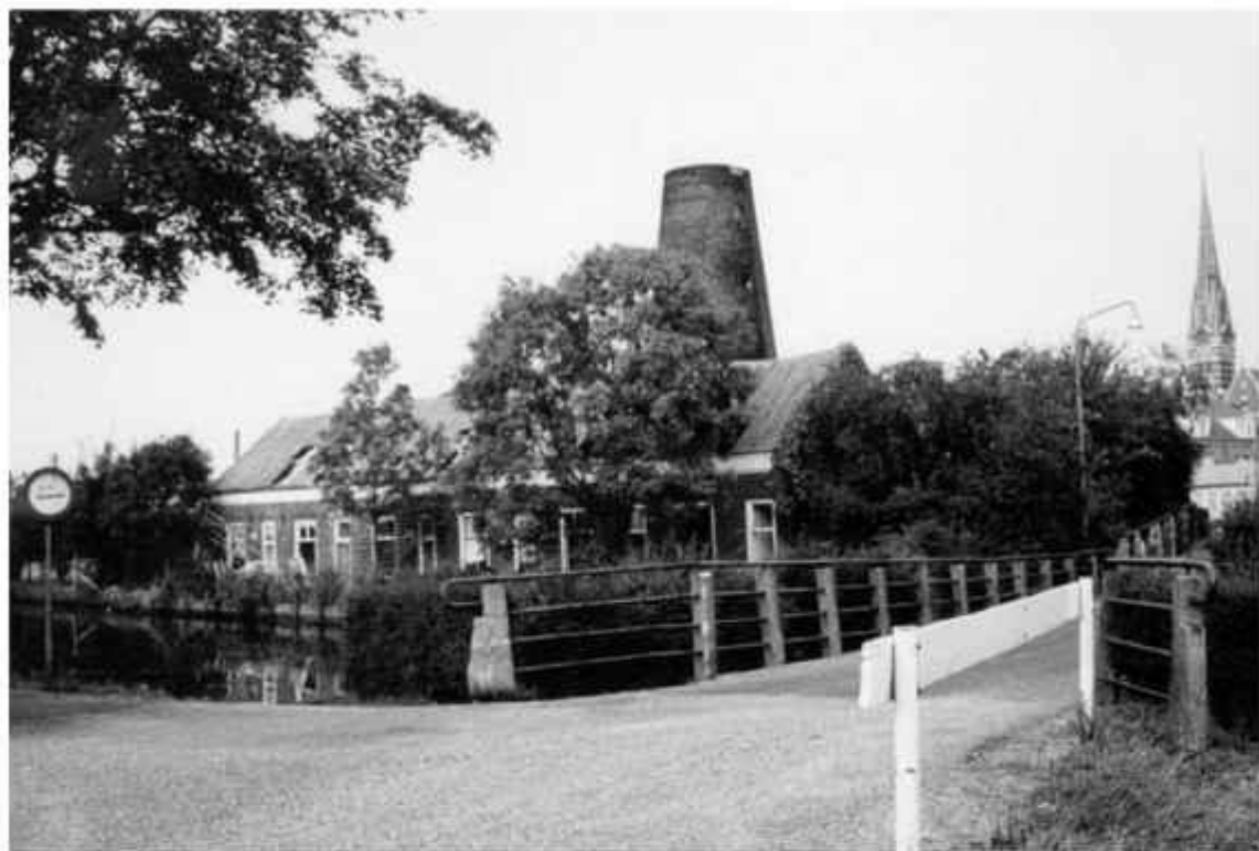
De Kolfbaan tegenover de Westersingel.