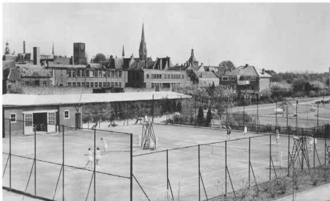
Tennispark De Doelen.