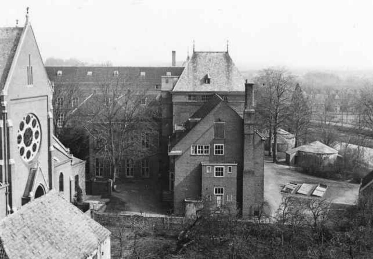
Het seminarie/studie- centrum; links de R.K. Barbarakerk.