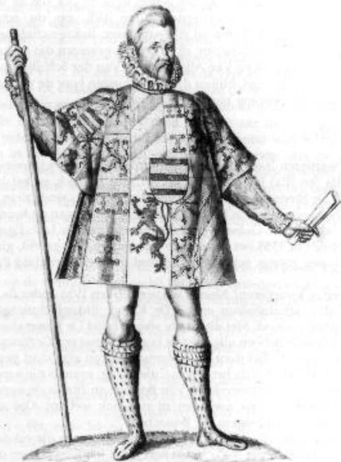
DEN HEROUT VAN WAPENEN VAN KUYLENBURG.

De Heraut Culemborg. Pentekening in het handschrift van Cornelis van Alkemade en mr. Pieter van der Schelling: Beschryvinge en afbeeldinge van de graven en gravinnen van Kuylenburg met derzelver Hooge afkomst, geslagt-rekening, allianciën en wapenschilden.