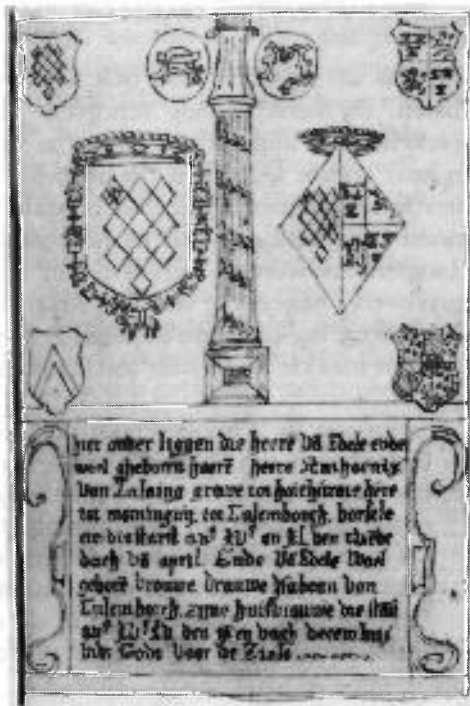
Grafplaat voor de harten van Anthonis van Lalaing en Elisabeth van Culemborg. Deze afbeelding uit het hs. d'Yvoy wijkt af van de afbeelding bij Lauwerijs.