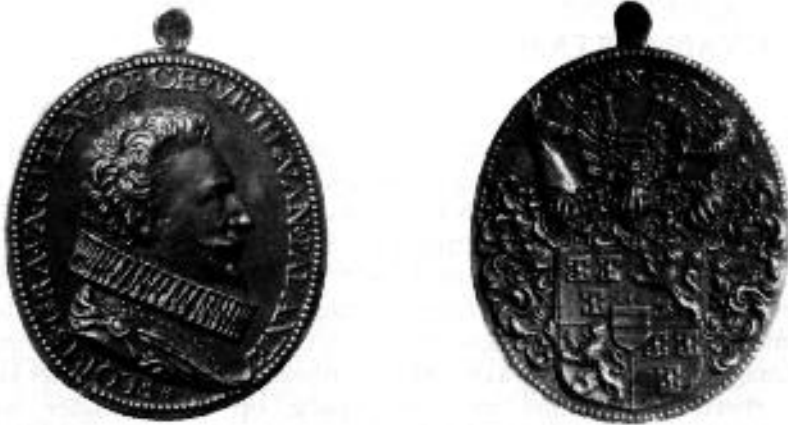
De door Symon Adriaensz. Rottermont gemaakte portretpenning.

hof van de graaf van Culemborg te Brussel in 1568. In dit hôtel was nl. het Verbond der edelen gesloten en waren bijeenkomsten daarvan gehouden, waarom Alva het met de grond gelijk liet maken. Van Loon verhaalt, hoe hem bij een bezoek aan Brussel in 1720 "eene diepe vierkante en met voordacht uytgegraave plaats aangewezen (werd), daar de kamer zoude gestaan hebben in welke eertijds de verbondene Edellieden hunne bijeenkomsten gehouden hebben". "Wat ook van die waerheyd zij, het is zeker", zo vervolgt hij, "dat van den Eygenaar van het gesloopte huys een gedenkpenning gevonden wordt, welke ik, mits hij zonder jaartal is, alhier plaats gunne".