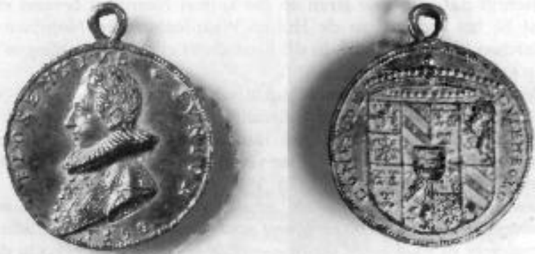
Gegoten zilveren portretpenning van de dertienjarige jonggraaf Floris II van Culemborg, 1590. Teylers Museum, Haarlem.