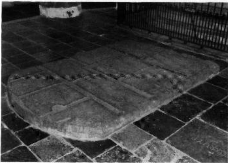
De hardstenen zerk op het hoge koor van de Grote Kerk