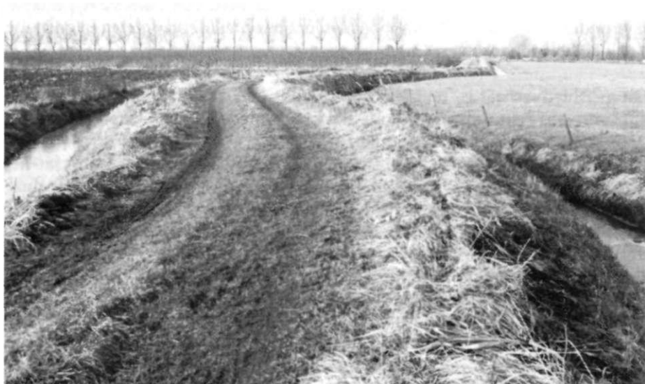
Het Paveise wegje tussen Holderweg en Lang Avontuurseweg heet tegenwoordig ook Holderweg.

dit kerspel, dat zijn naam wellicht aan het Italiaanse Pavia ontleend heeft, dateert uit de twaalfde eeuw.