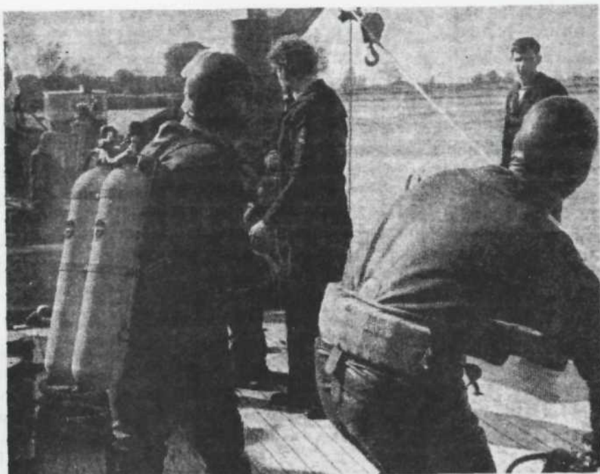
Kivormsmannen van de in de haven afgemeerde duiksloep Hydra gaan te water tijdens de beide marinedagen in mei 1969.