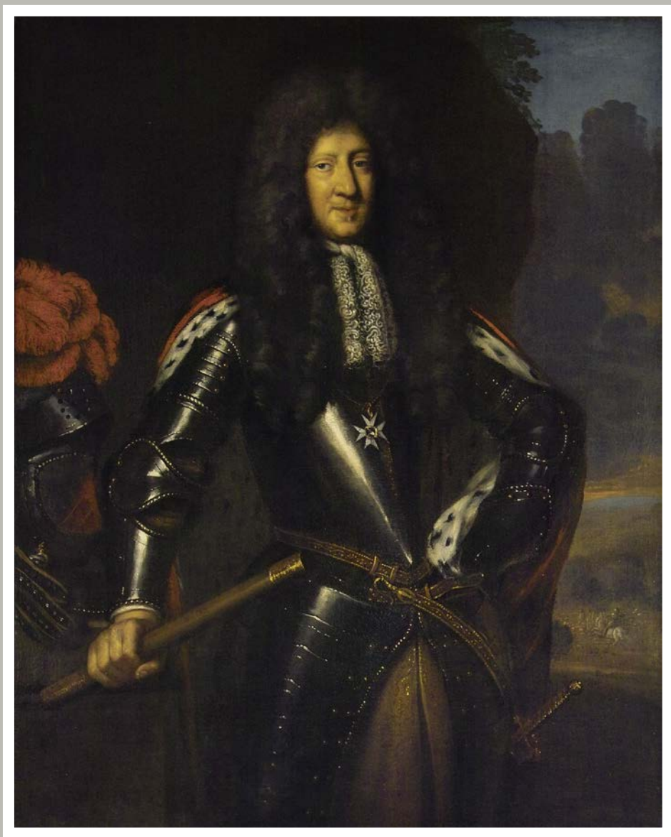
GEORGE FREDERIK VAN WALDECK, GRAAF VAN CULEMBORG 1664-1692 Schilderij collectie MEW