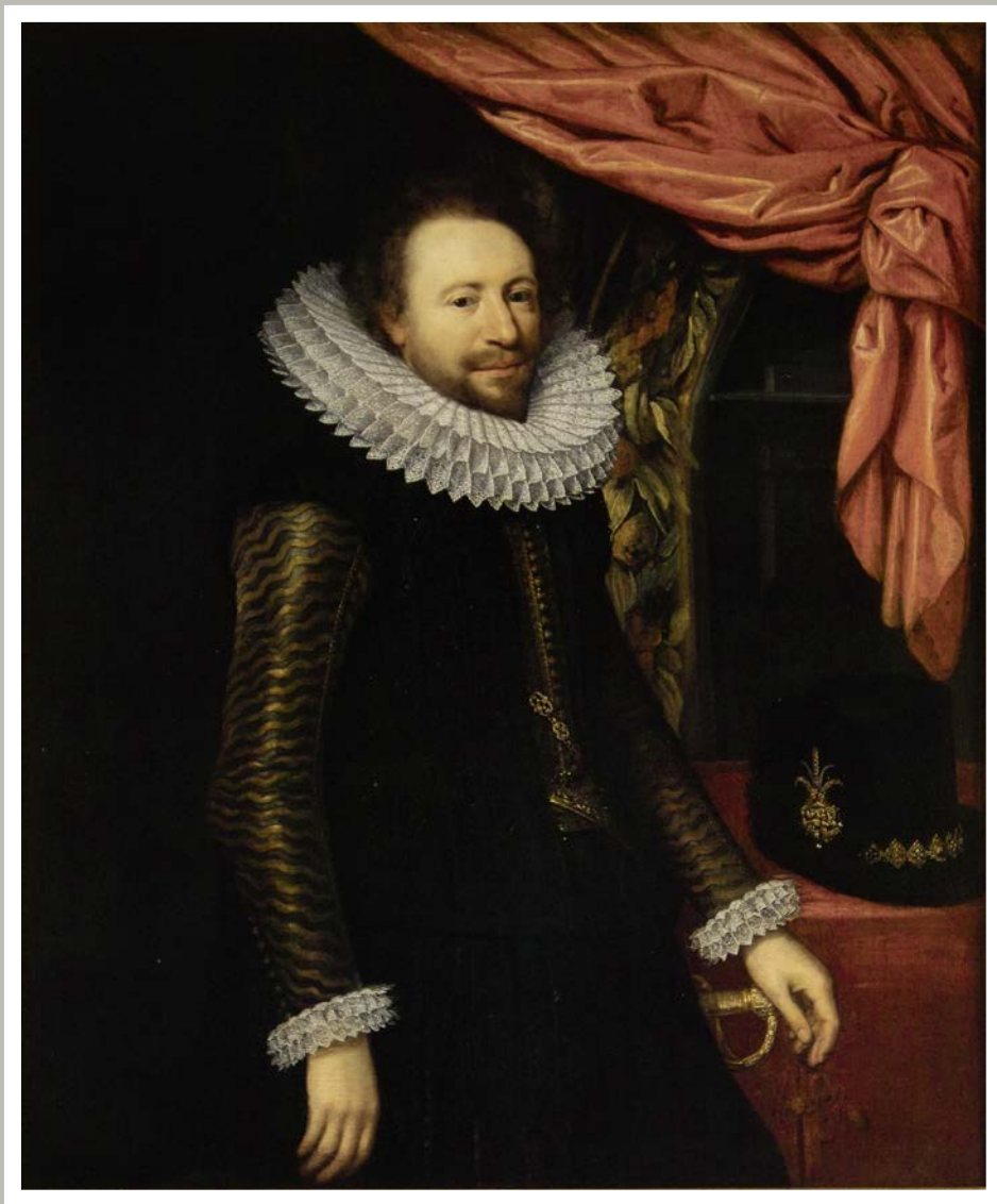
FLORIS II VAN PALLANDT, GAAAF VAN CULEMBORG 1598-1639 Schilderij collectie MEW