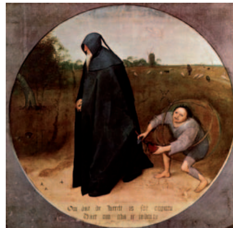
DE BEURZENSNIJDER IN HET SCHILDERIJ 'DE TROUWeloosHEID VAN DE WERELD' VAN PIETER BRUEGHEL DE OUDE.