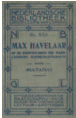
DE UITGAVE VAN MAX HAVELAAR OF DE KOFFIVEILINGEN DER NEDERLANDSCHE HANDELSMAATSCHAPPIJ UIT 1907.